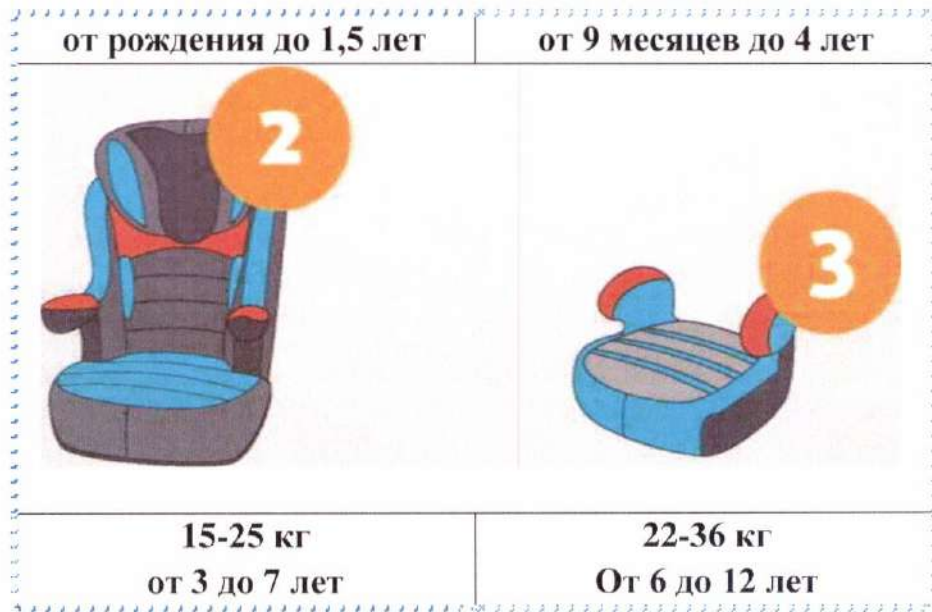
Рисунок 1. Виды детских удерживающих устройств.

Детские удерживающие устройства можно разделить по группам в зависимости от веса и возраста детей.