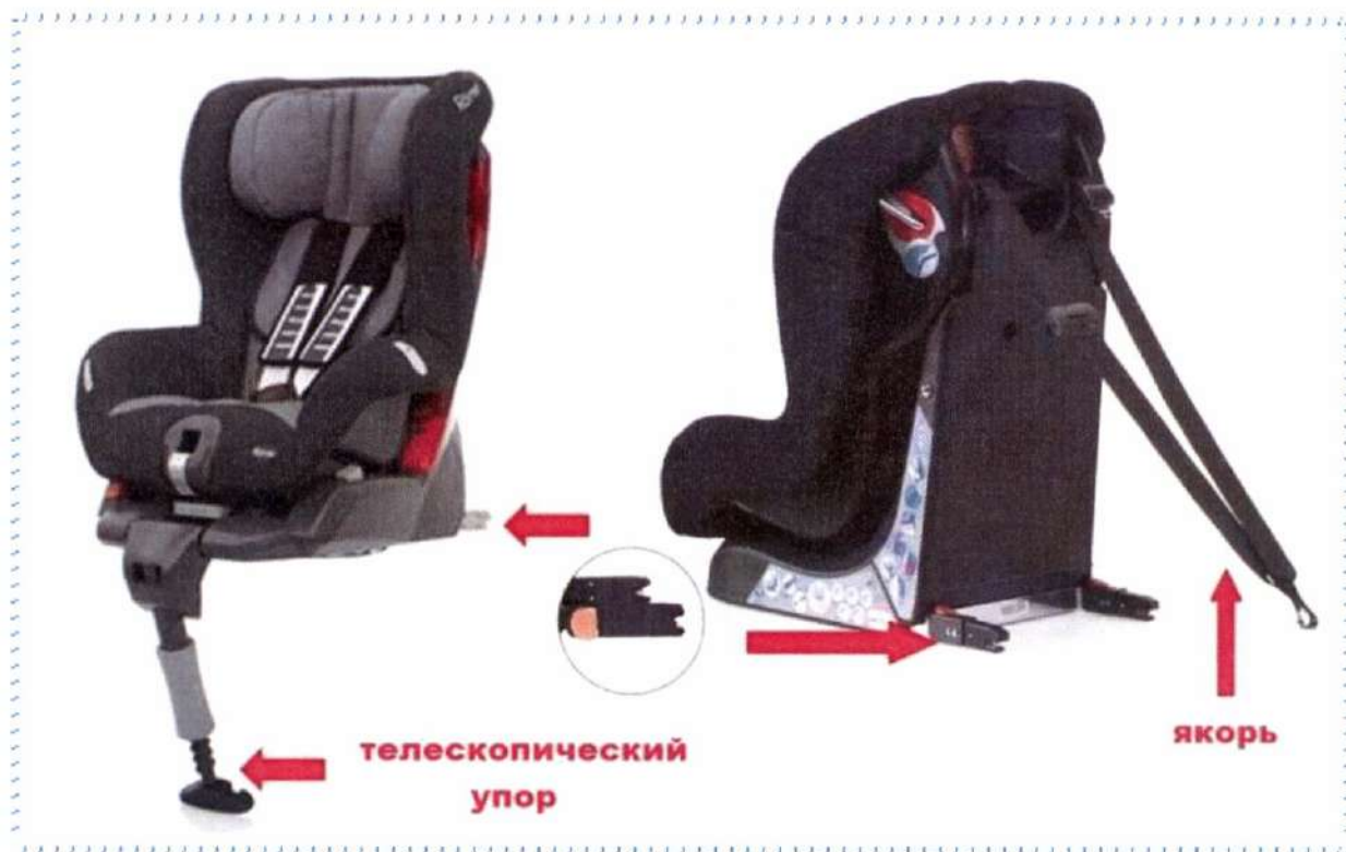
Рисунок 6. Телескопический упор и якорное крепление

Телескопический упор и якорное крепление разработаны специально для того, чтобы в момент столкновения снизить нагрузку на основное крепление детского автокресла, избежать возможности «клюющего» движения при лобовом столкновении и этим обеспечить более высокую безопасность в аварийных ситуациях.