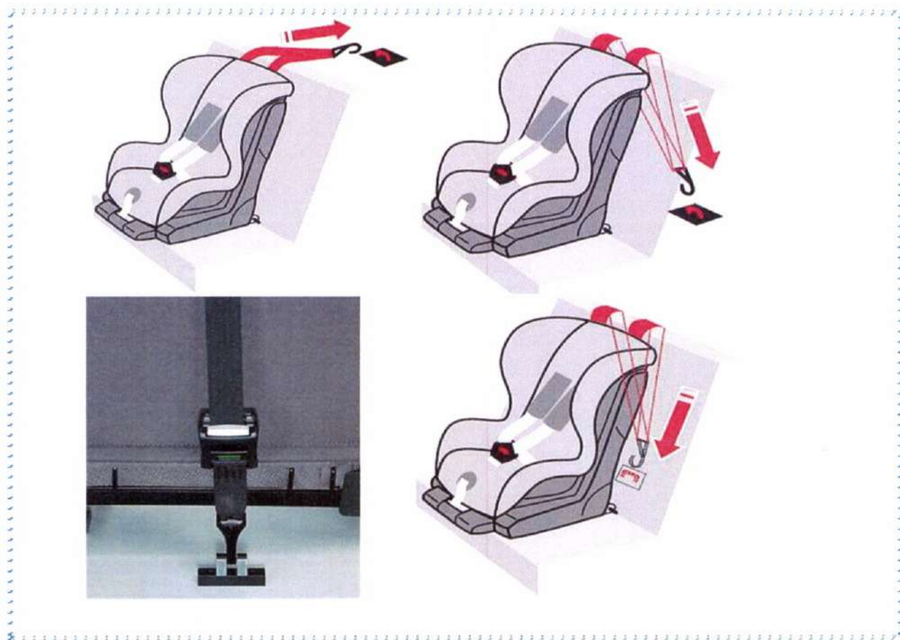
Рисунок 7. Способы фиксации якорного крепления

После того, как автокресло установлено, необходимо учесть ряд условий при усаживании в него ребенка.