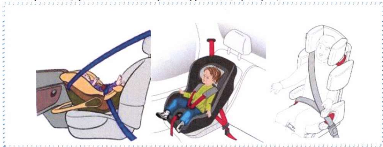
Рисунок 4. Крепление штатными ремнями безопасности

- фиксация ребенка ремнем безопасности автомобиля, вместе с детским автокреслом (применяется для кресел групп 2, 3, бустеров).