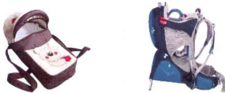
Люлька-переноска не предназначена для автомобиля