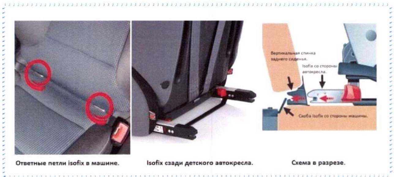
Рисунок 5. Крепления ISOFIX

Система крепления ISOFIX дает возможность быстрого и надежного крепления. За счет быстрозажимных устройств кресло надежно фиксируется и также легко снимается. Не приходится лишний раз беспокоить ребенка.