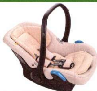
Автокресло группы 0+ для детей массой менее 13 кг