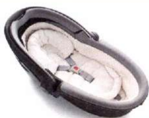
Автокресло «люлька» группы 0 для детей массой менее 10 кг

Детские удерживающие устройства подразделяют на 5 весовых групп: