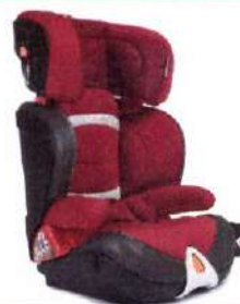
Автокресло группы III для детей массой 22-36 кг (возможно использование бустера)

«Направляющая лямка» («треугольник», «адаптер», «фиксатор»)