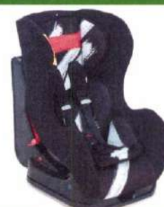
Автокресло группы I для детей массой 9-18 кг