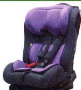
Автокресло группы II для детей массой 15-25 кг